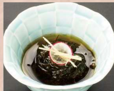
もづく酢 380 円(税込 418円)