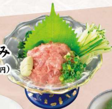
ねぎとろつまみ 580 円(税込 638円)