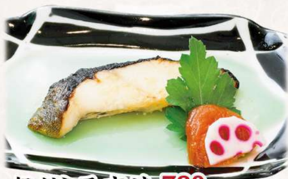
銀だら西京焼 780 円(税込 858円)