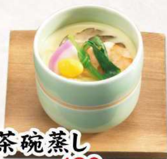
茶碗蒸し 480 円(税込 528円)