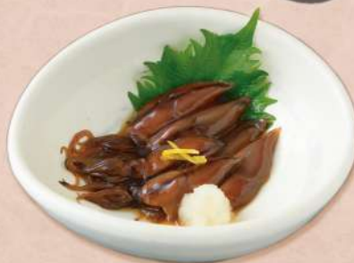
ホタルイカの沖漬 480 円(税込 528円)