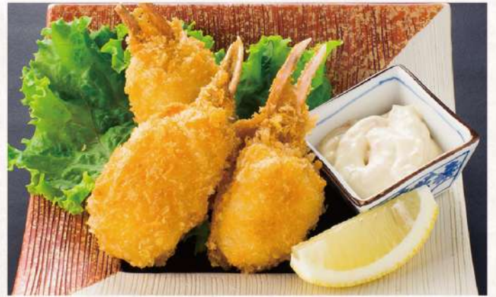
かにクリームコロッケ