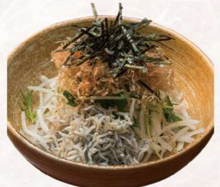
釜揚げしらすと水菜のサラダ