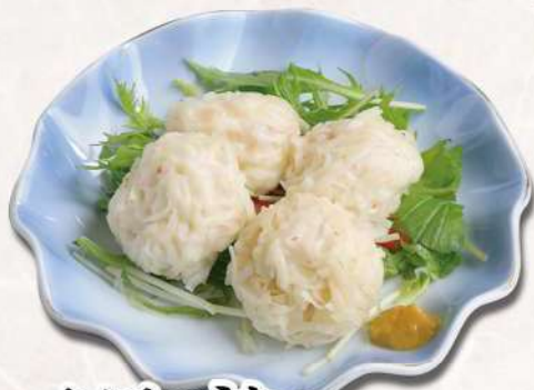
かにしゅうまい 580 円(税込 638円)