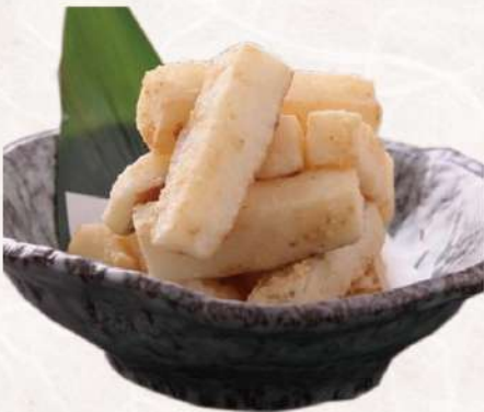
山芋フライポテト