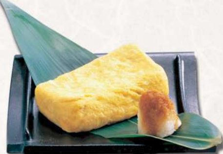
玉子焼 680 円(税込 748円)