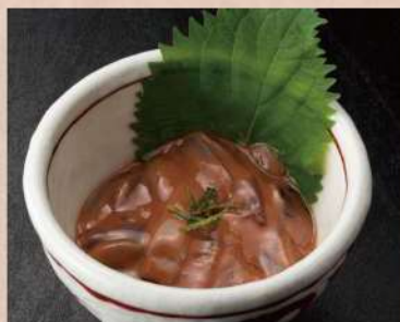
いかの塩辛 380 円(税込 418円)