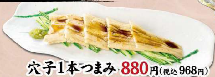
穴子1本つまみ 880 円(税込 968円)