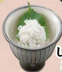
しらすおろし 380 円(税込 418円)