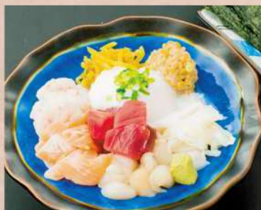
おつまみばくだん 780 円(税込 858円)