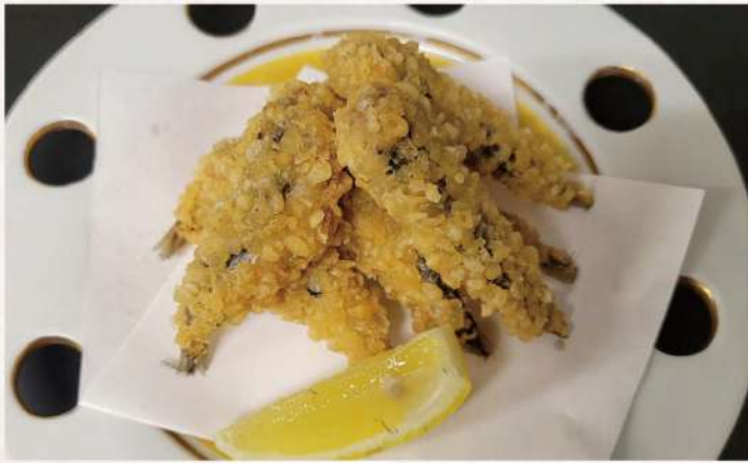
いわしかりかり揚げ