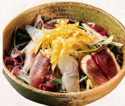
寿し常海鮮サラダ