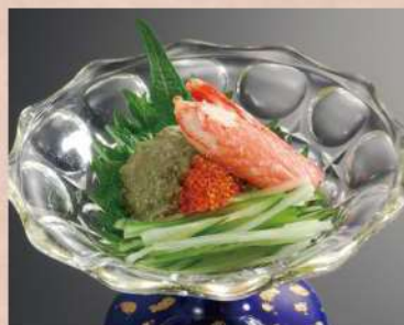
かに味噌つまみ 580 円(税込 638円)