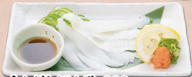
えんがわぽん酢 880 円(税込 968円)