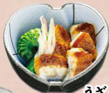
うづく 680 円(税込 748円)