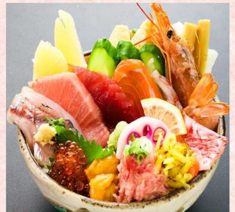
特上ちらし 2,180円 (税込 2,398円)