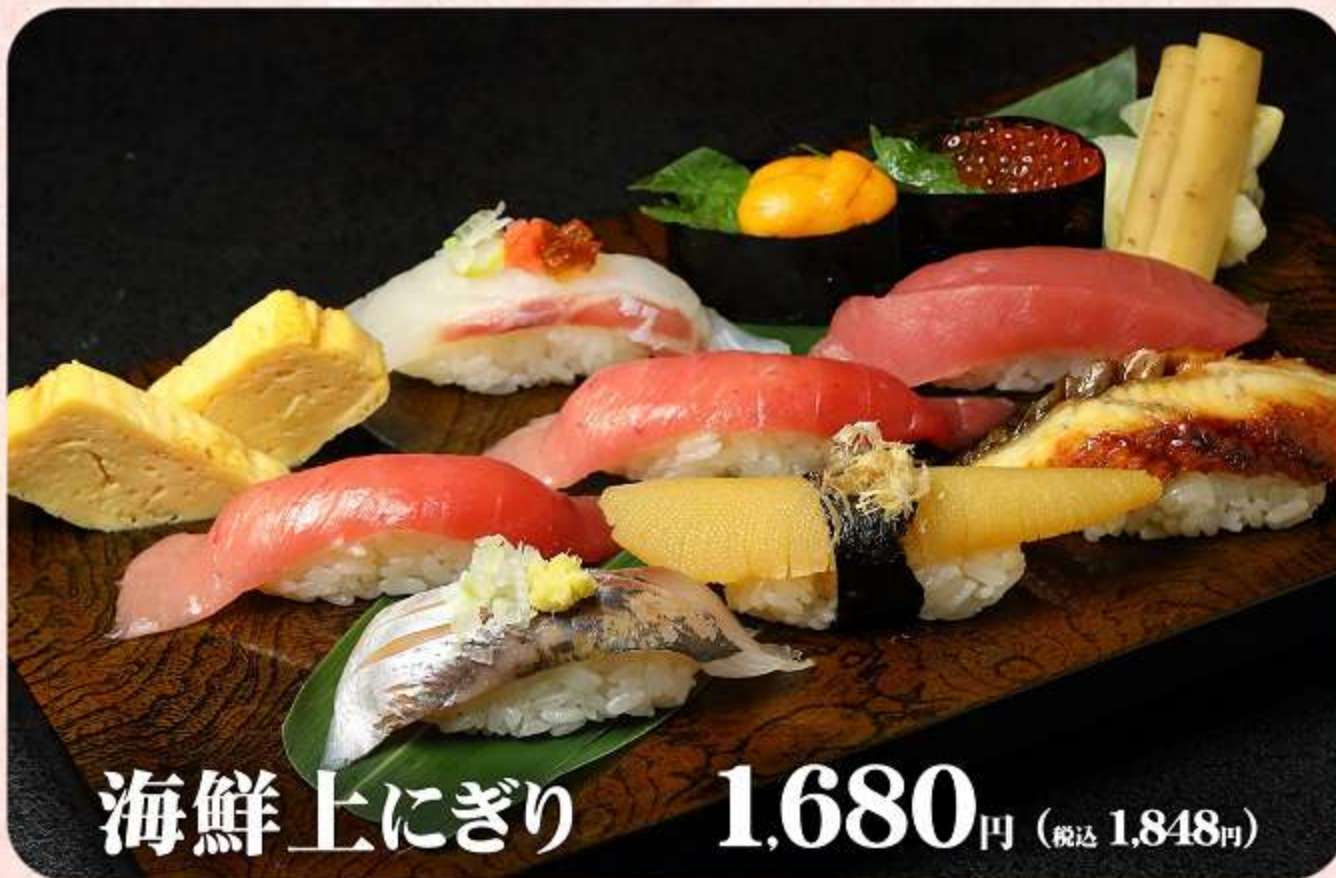
海鮮上にぎり 1,680円 (税込 1,848円)