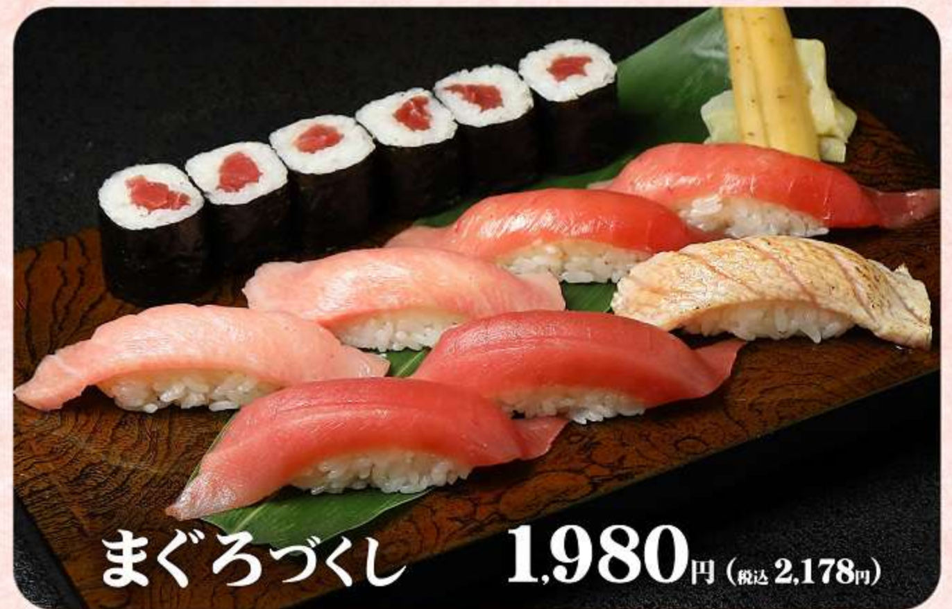
まぐろづくし 1,980円 (税込 2,178円)