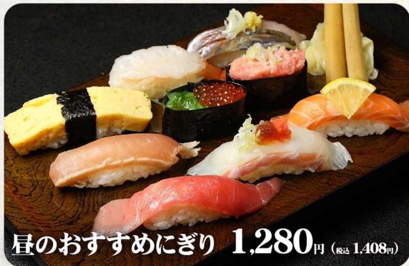
昼のおすすめにぎり 1,280円 (税込 1,408円)