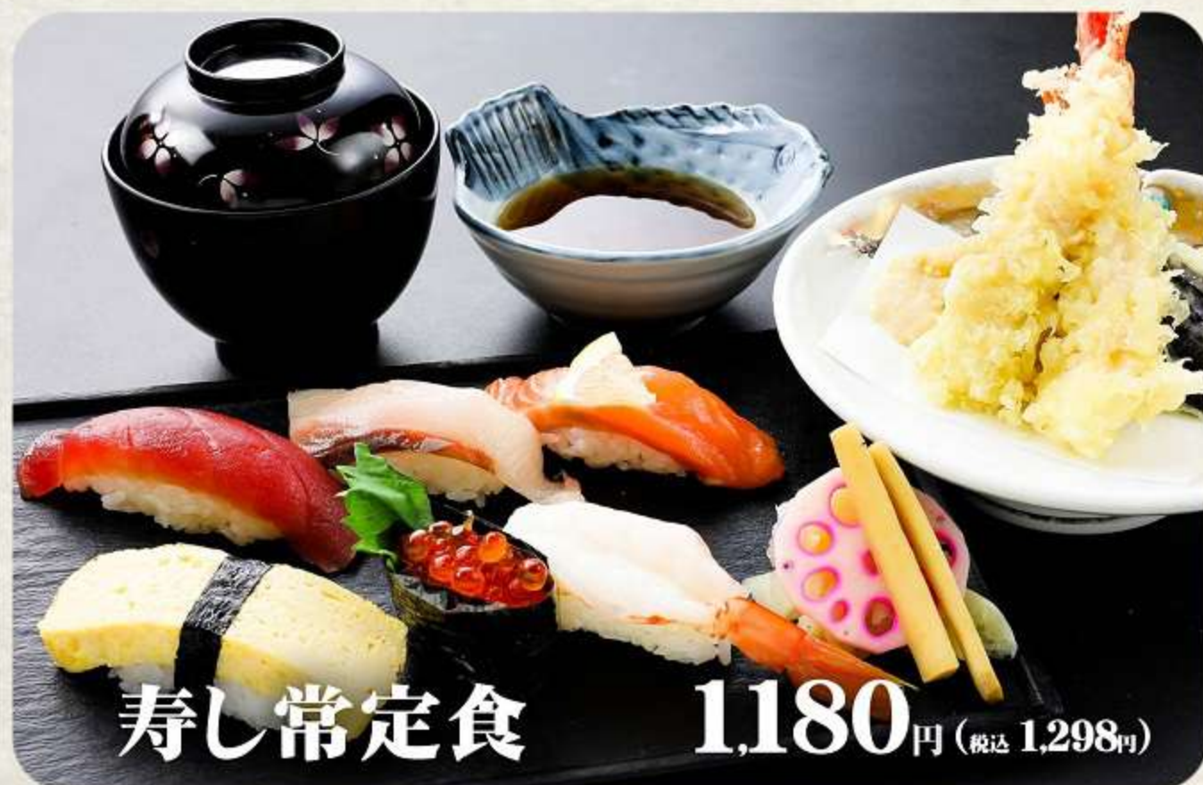
壽し常定食 1,180円 (税込 1,298円)