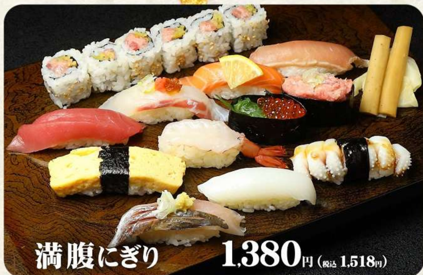
満腹にぎり 1,380円 (税込 1,518円)