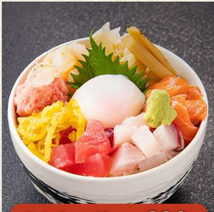
まかない丼 980円 (税込 1,078円)