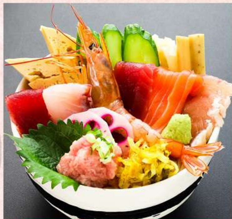
海鮮丼 1,180円 (税込 1,298円)