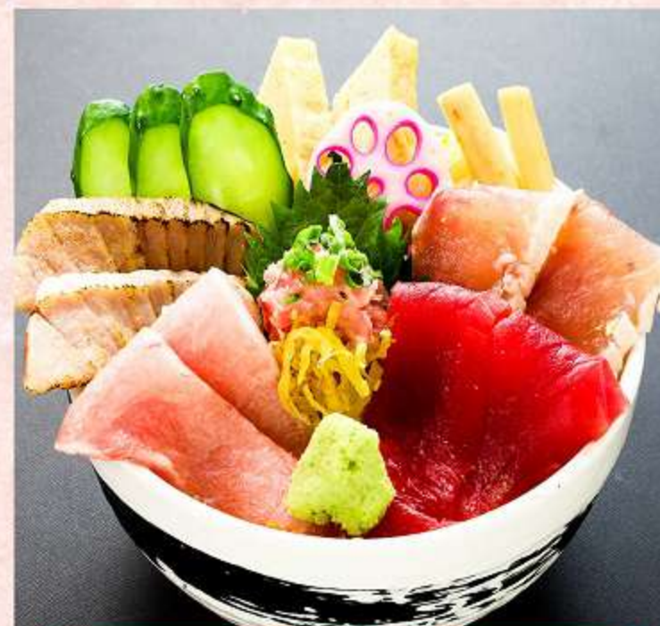
特選まぐろ丼 1,980円 (税込 2,178円)