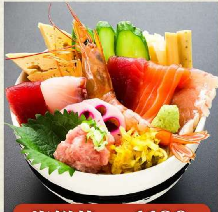
海鮮丼 1,180円 (税込 1,298円)