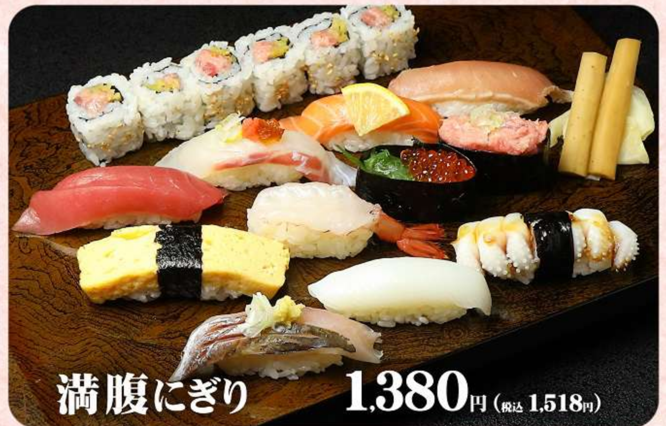
満腹にぎり 1,380円 (税込 1,518円)