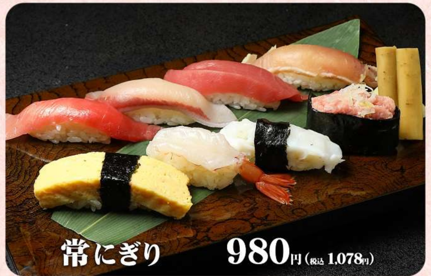
常にぎり 980円 (税込 1,078円)