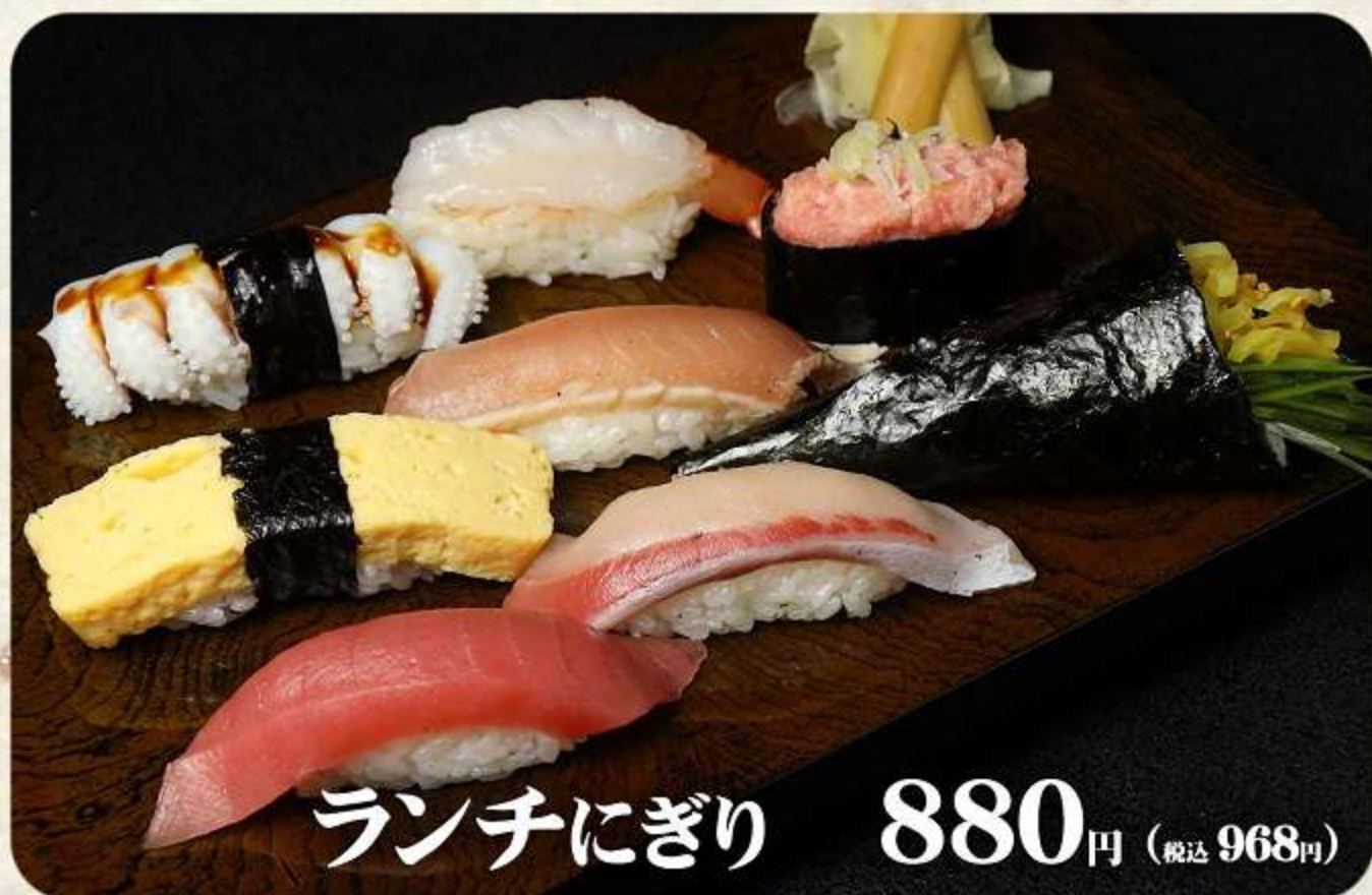
ランチにぎり 880円 (税込 968円)